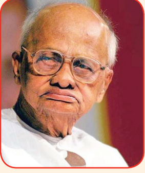
ಡಾ. ದೇ. ಜವರೇಗೌಡ

“ದೇಜಗೌ” ಎಂಬ ಹೆಸರಿನಿಂದಲೇ ಕನ್ನಡ ಶಿಕ್ಷಣ ಹಾಗೂ ಸಾಹಿತ್ಯ ಕ್ಷೇತ್ರದಲ್ಲಿ ಖ್ಯಾತರಾದವರು ದೇ. ಜವರೇಗೌಡ.