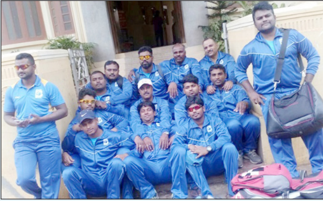
ಬೆಸ್ಕಾಂ ಬ್ಲೂಸ್ @ ಹುಬ್ಬಳ್ಳಿಯ ಪಂದ್ಯ-2016

ಬೆಂಗಳೂರು ವಿದ್ಯುತ್ ಸರಬರಾಜು ಕಂಪನಿಯು ಭಾರತದ 2ನೇ ಅತ್ಯುತ್ತಮ ರಾಷ್ಟ್ರೀಯ ವಿದ್ಯುತ್ ಸಂರಕ್ಷಣಾ ಪ್ರಶಸ್ತಿಯನ್ನು ಪಡೆದುಕೊಂಡಿದ್ದು, ಮಾನ್ಯ ವ್ಯವಸ್ಥಾಪಕ ನಿರ್ದೇಶಕ, ಬೆವಿಕಂ ರವರು ಈ ಪ್ರಶಸ್ತಿಯನ್ನು ಇಂಧನ ಸಚಿವಾಲಯ ಭಾರತ ಸರ್ಕಾರದ ವತಿಯಿಂದ ಸ್ವೀಕರಿಸುತ್ತಾರೆ.