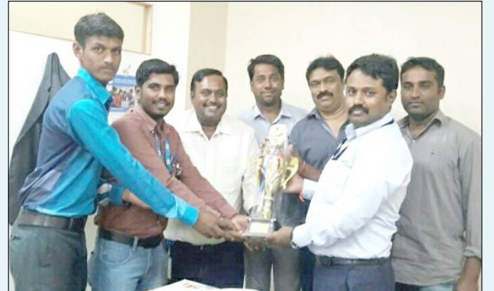
ಬೆವಿಕಂ ಹಣಕಾಸು ನಿರ್ದೇಶಕರಿಗೆ BLE T20 ಕಪ್ ಹಸ್ತಾಂತರ