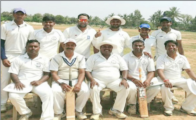
BLE-T20 ಪಂದ್ಯದ ವಿಜೇತರು-ಬೆವಿಕಂ ತಂಡ-2016