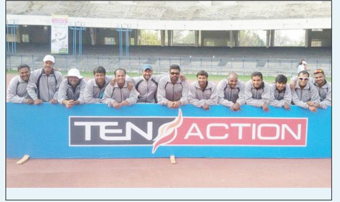
ಬೆವಿಕಂ/ ಕವಿಪ್ರನಿನಿ ಕ್ರಿಕೆಟ್ ತಂಡ- ಕೋಲ್ಕತ್ತಾ ಪ್ರವಾಸದ ಸಮಯ