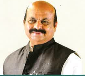
ಶ್ರೀ ಬಸವರಾಜ ದಾಸ, ಬೊಮ್ಮಾಯಿ ಸನ್ಮಾನ್ಯ ಮುಖ್ಯಮಂತ್ರಿಗಳು