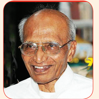
ಡಾ. ಗೊ. ರು. ಚನ್ನಬಸಪ್ಪ

ಹಿಂದಿರುಗಿಸುತ್ತಿದ್ದರು. ಸಾಹಿತ್ಯ ಸಮ್ಮೇಳನಗಳ ರೀತಿಯಲ್ಲಿಯೇ ಊರೂರುಗಳಲ್ಲಿ ಸಾಹಿತ್ಯ, ಕಲೆ, ವಿಜ್ಞಾನ ಕ್ಷೇತ್ರಗಳ ಮಹತ್ವದ ವಿಷಯಗಳನ್ನು ಕುರಿತು ತೌಲನಿಕವಾಗಿ ಚರ್ಚೆ ಮಾಡುವ ರೀತಿಯಲ್ಲಿ ಸಮಾವೇಶವನ್ನು ಏರ್ಪಡಿಸಿದರು. ಹಲವಾರು ಮೌಲಿಕ ಕೃತಿಗಳನ್ನು ಪ್ರಕಟಿಸಿದರು.