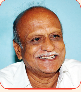
ಡಾ. ಎಂ. ಎಂ. ಕಲಬುರ್ಗಿ