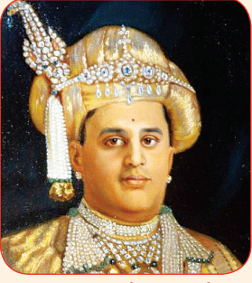
ಶ್ರೀ ಜಯಚಾಮರಾಜೇಂದ್ರ ಒಡೆಯರ್

ಕರ್ನಾಟಕದ ಚರಿತ್ರೆಯಲ್ಲಿ 'ಮೈಸೂರು ಸಂಸ್ಥಾನವು' ಜನಪರ ಆಡಳಿತ, ಸಾಮಾಜಿಕ ನ್ಯಾಯ ಹಾಗೂ ಸಾಹಿತ್ಯ, ಸಂಗೀತ, ಸಂಸ್ಕೃತಿಯ ಪೋಷಣೆಗಾಗಿ ಮಹತ್ವದ ಸ್ಥಾನ ಪಡೆದಿದೆ.