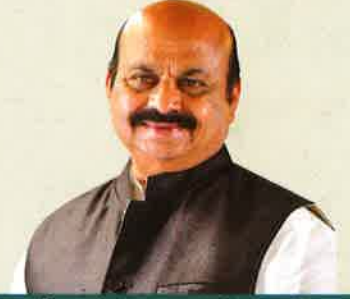
ಶ್ರೀ ಬಸವರಾಜ ಎಸ್. ಬೊಮ್ಮಾಯಿ ಸನ್ಮಾನ್ಯ ಮುಖ್ಯಮಂತ್ರಿಗಳು